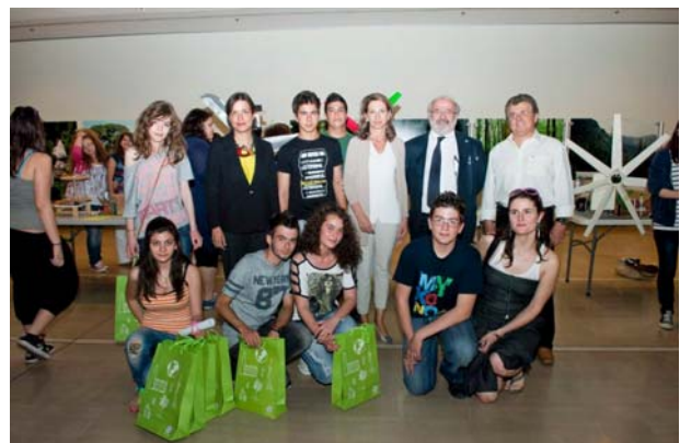
Στιγμιότυπο από τη βράβευση