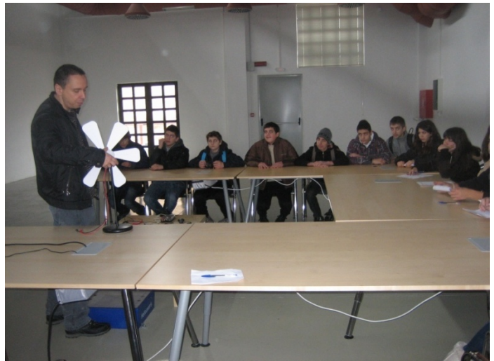
Επίσκεψη στο Εργαστήριο Παραγωγής Υδρογόνου και στο Κ.Π.Ε. Λαυρίου