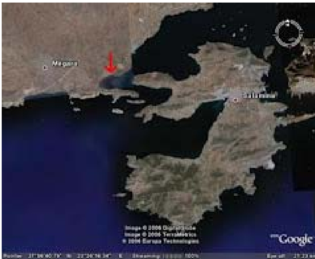
VourkariWetland --Υγρότοπος Βουρκαρίου