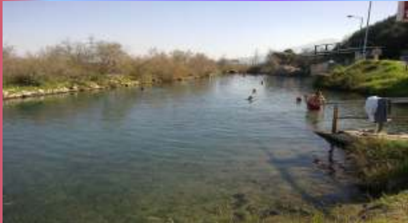
Πηγές Καλλιδρόμου (Ψωρονέρια)