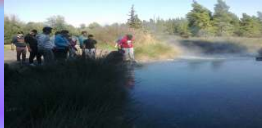
Ιαματικές πηγές Θερμοπυλών