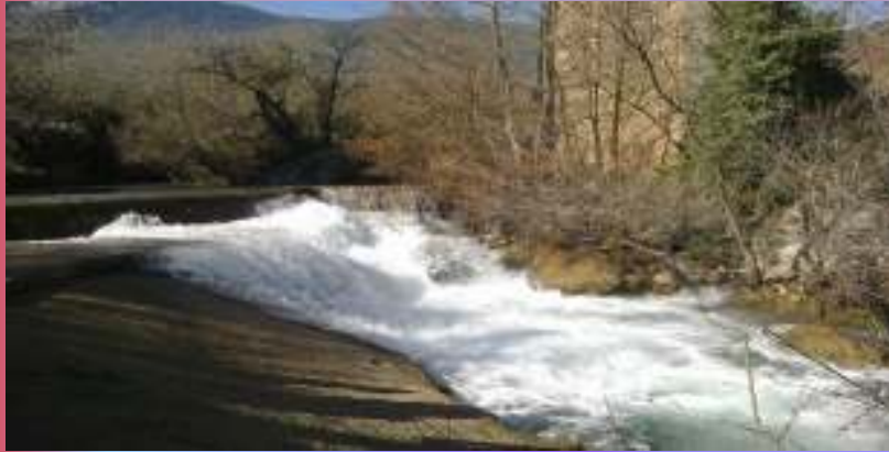
Στον Γοργοπόταμο και την ιστορική του γέφυρα