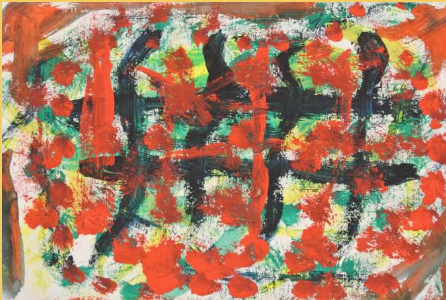
«Η ΧΑΡΑ ΠΙΣΩ ΑΠΟ ΤΗ ΣΚΛΑΒΙΑ ΚΑΙ ΤΟ ΑΙΜΑ»