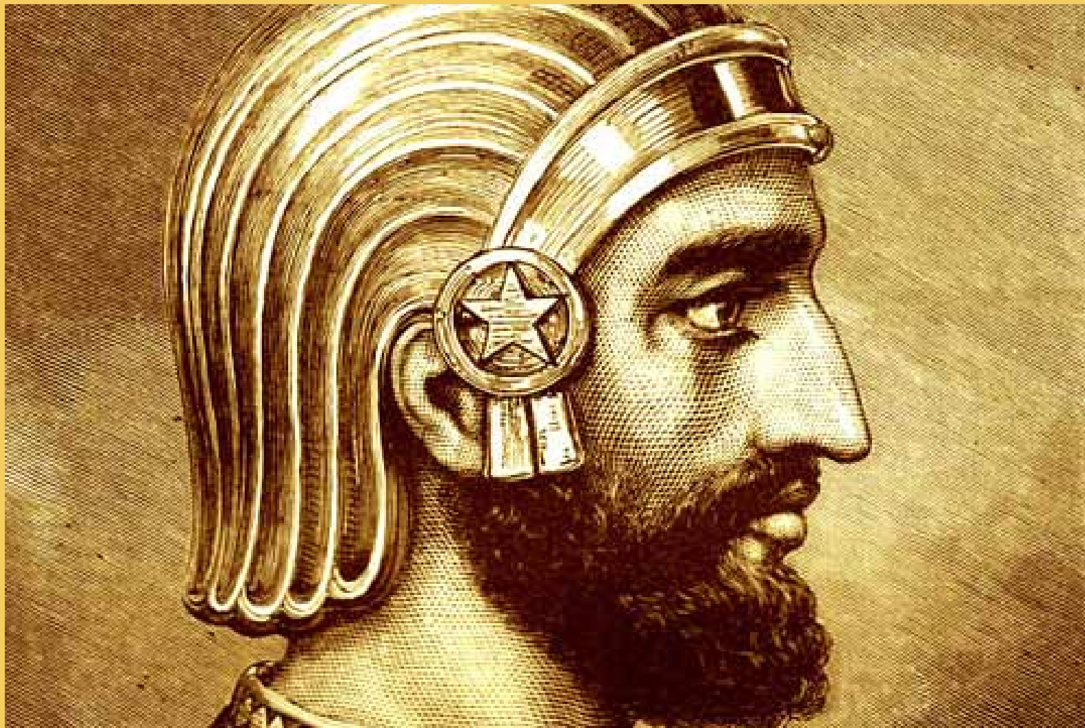
ΚΥΡΟΣ Ο ΜΕΓΑΣ (539 π. Χ)