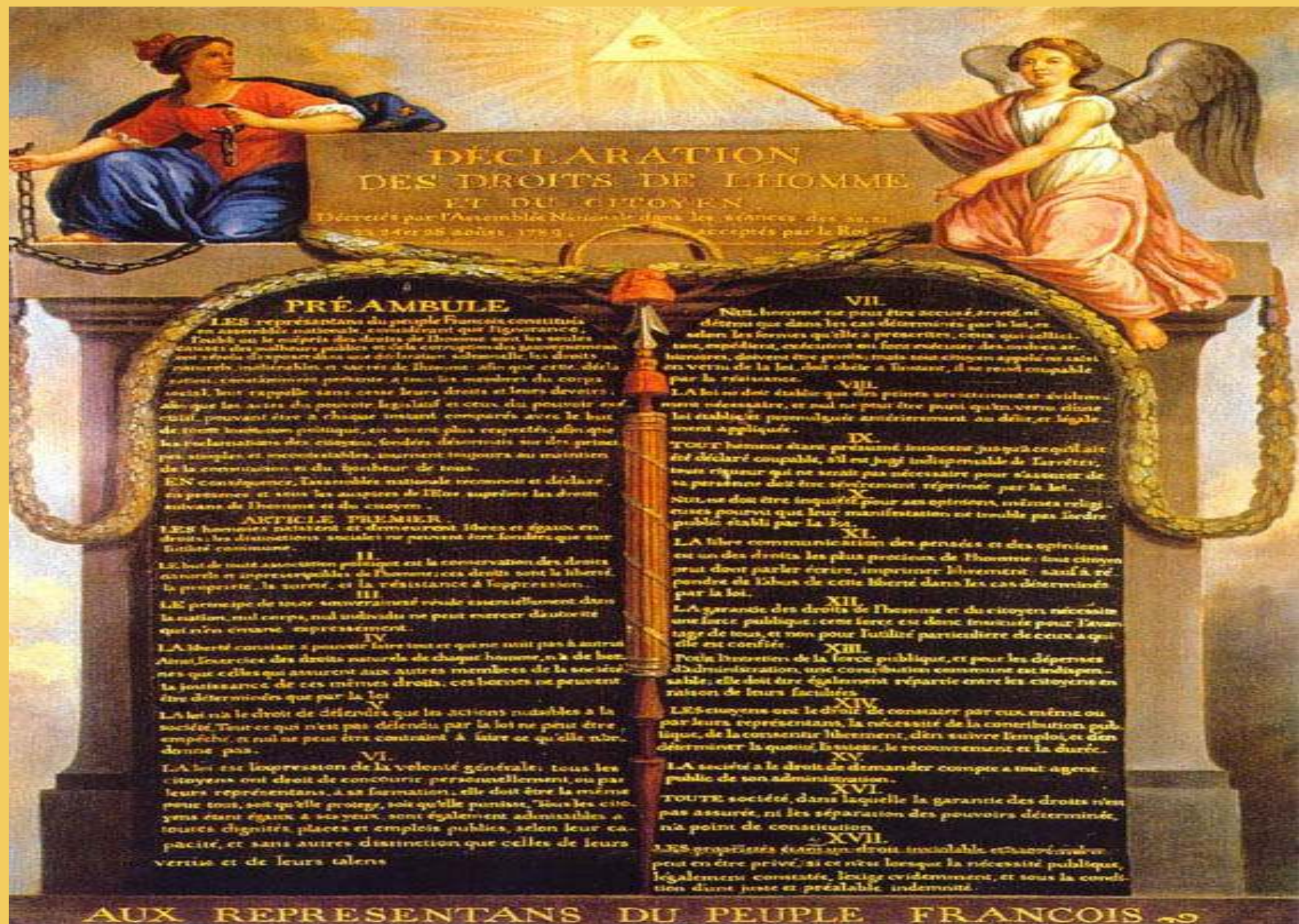
Η ΔΙΑΚΗΡΥΞΗ ΤΩΝ ΔΙΚΑΙΩΜΑΤΩΝ ΤΟΥ ΑΝΘΡΩΠΟΥ ΚΑΙ ΤΟΥ ΠΟΛΙΤΗ (ΓΑΛΛΙΑ 1789)