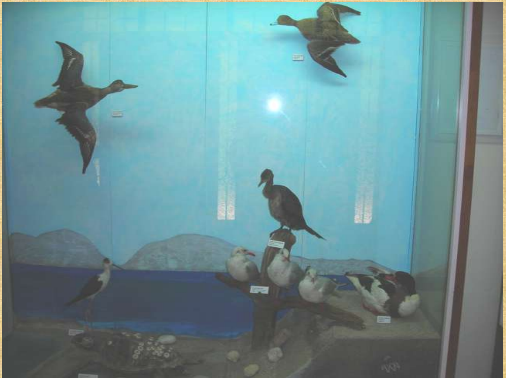
Απ' το Μουσείο Φυσικής Ιστορίας στην Κοιλιάδα των Πεταλούδων