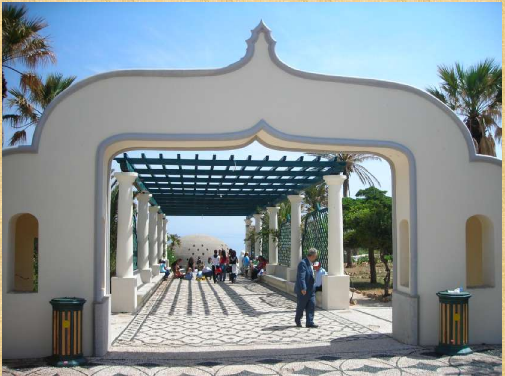
Η είσοδος στα Λουτρά της Καλλιθέας