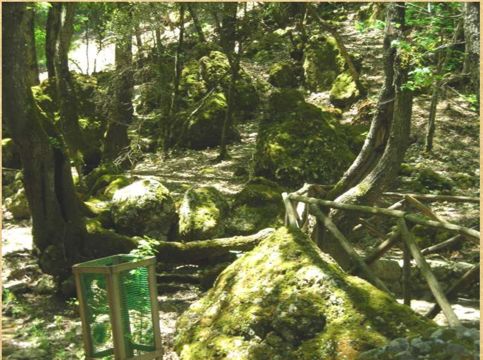
Εικόνες απ' την κοιλάδα