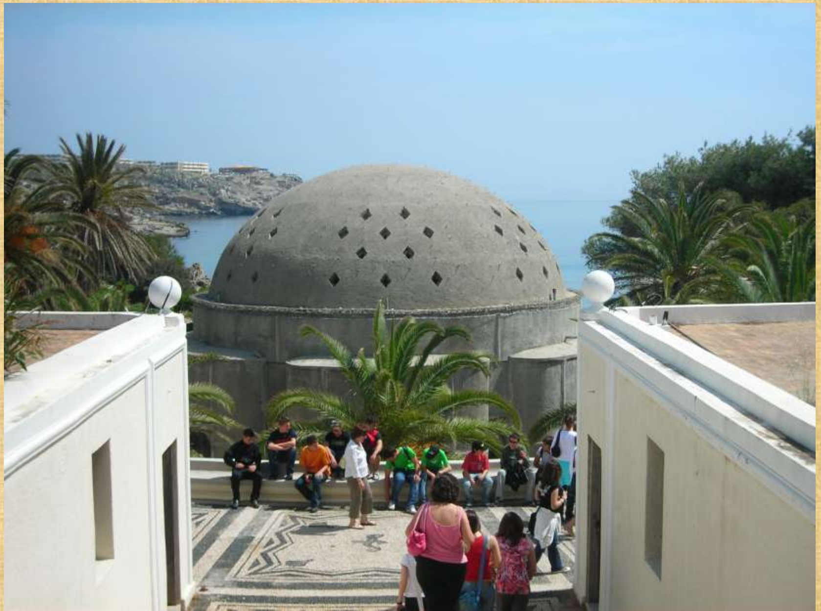
Ο χώρος των Λουτρών