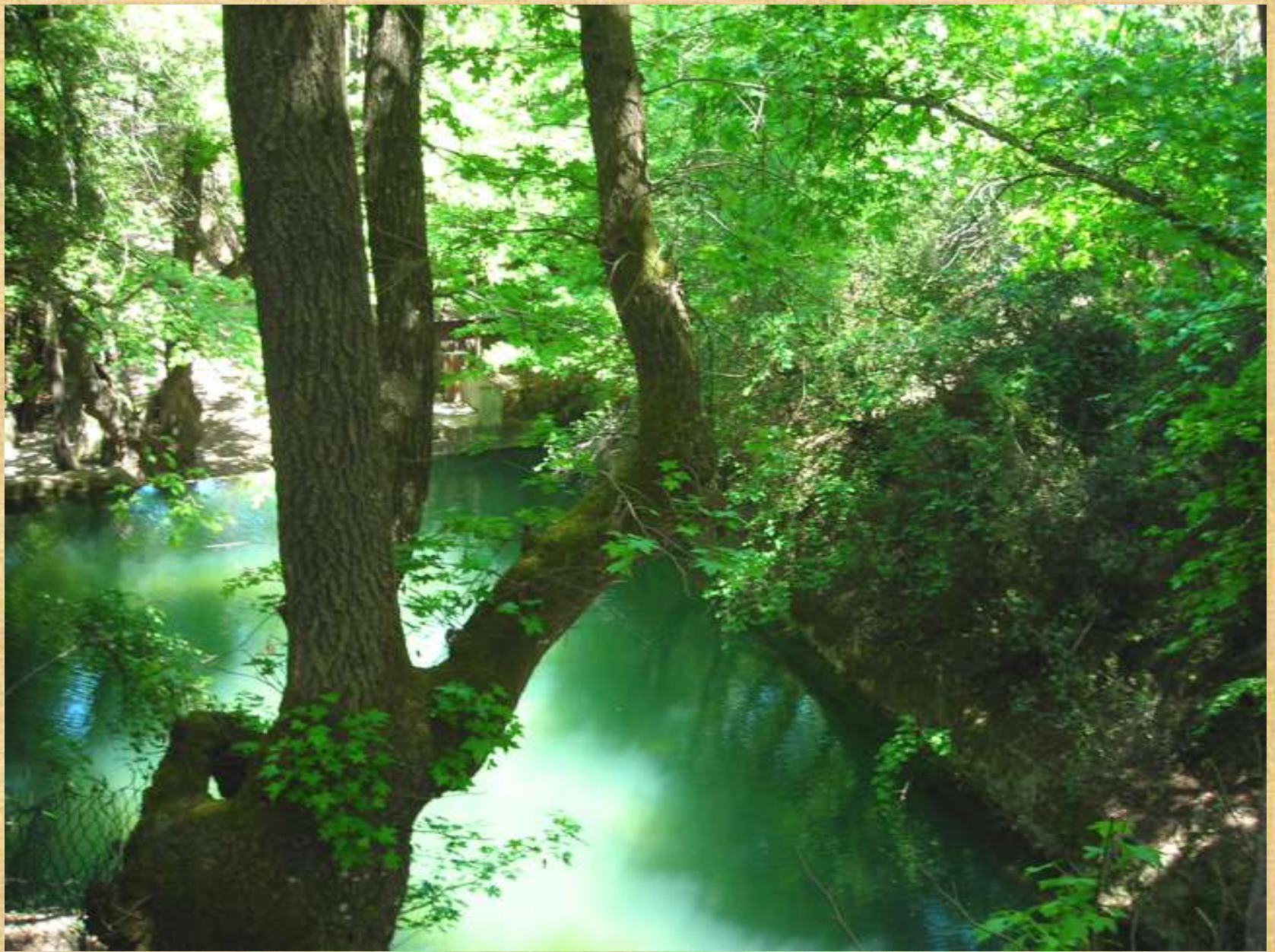
Εικόνες απ' την κοιλάδα