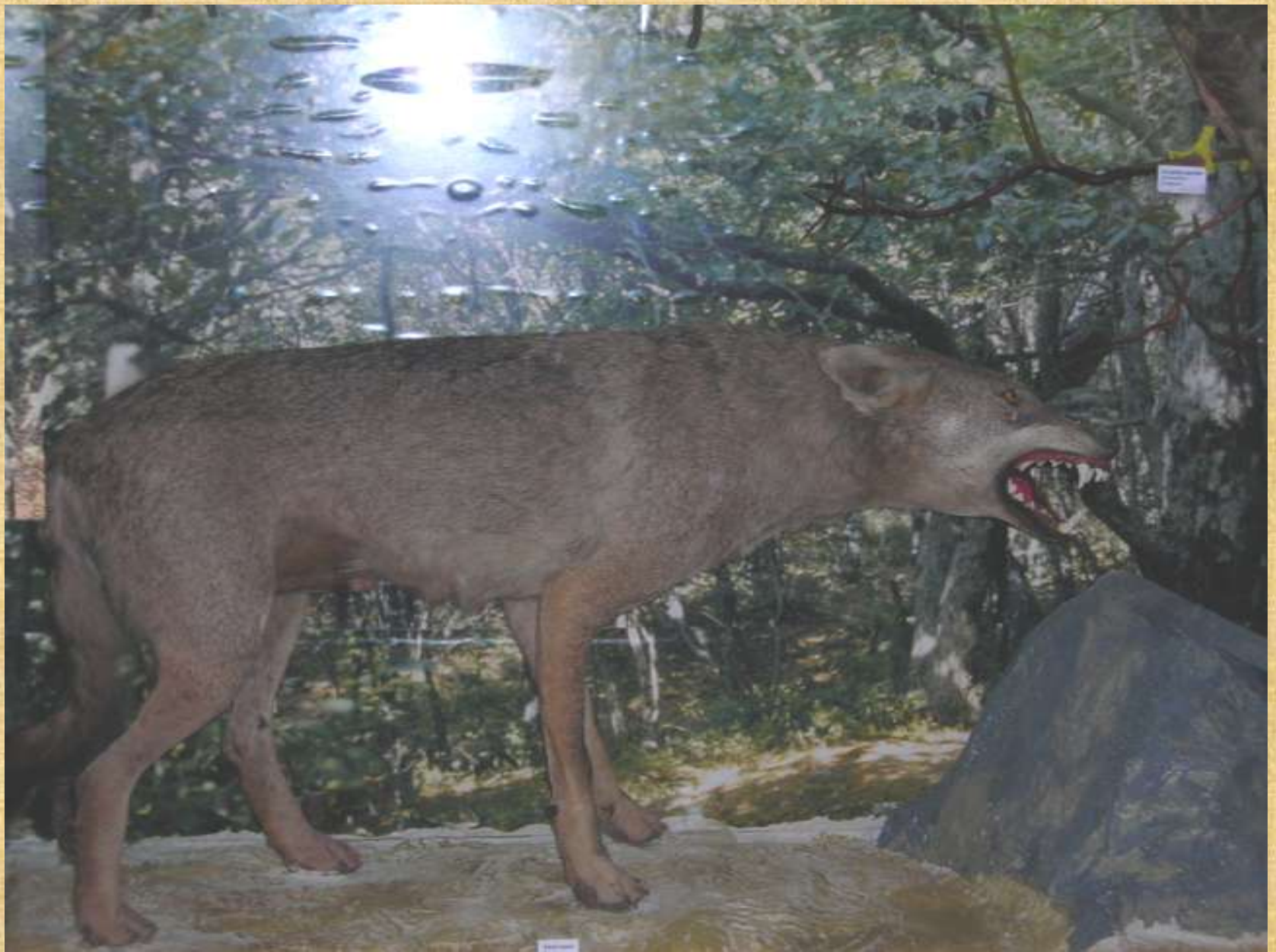
Απ' το Μουσείο Φυσικής Ιστορίας στην Κοιλιάδα των Πεταλούδων