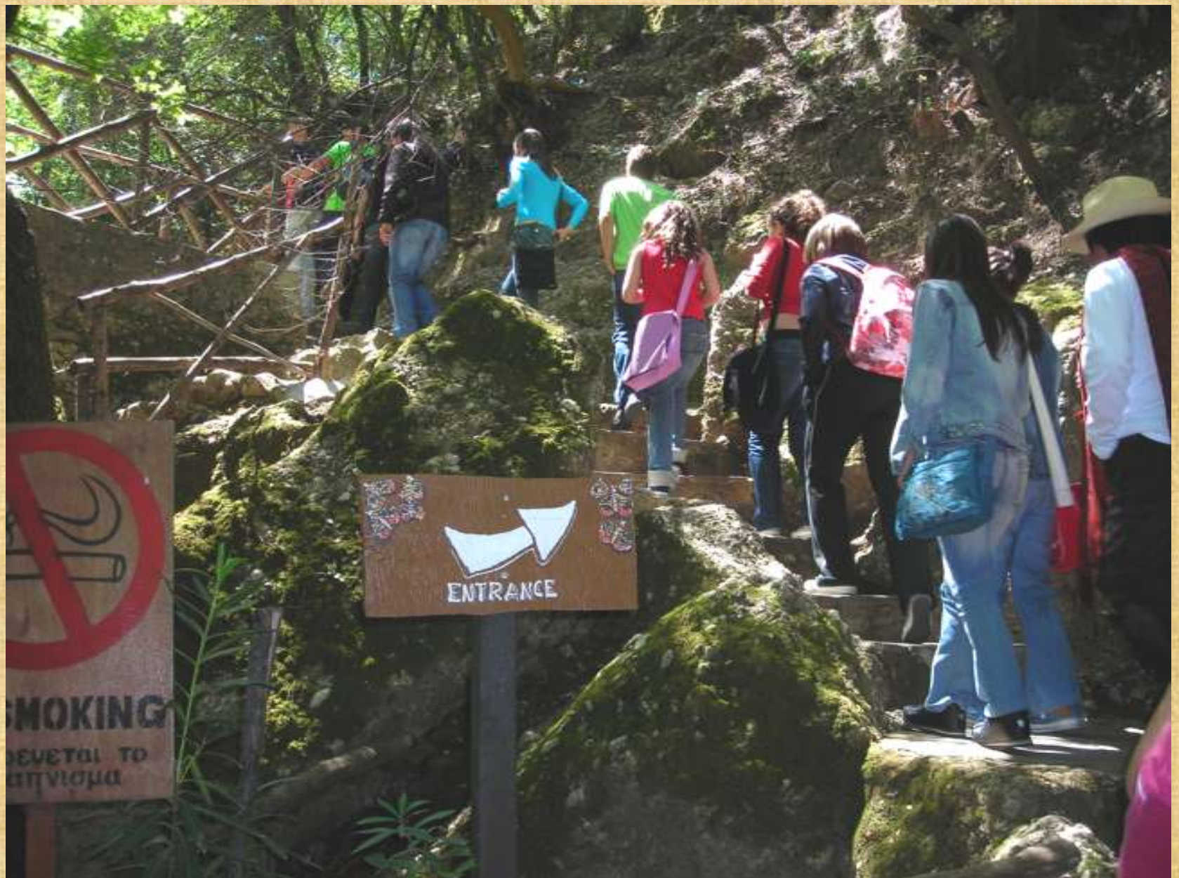
Είσοδος στην κοιλάδα των Πεταλούδων