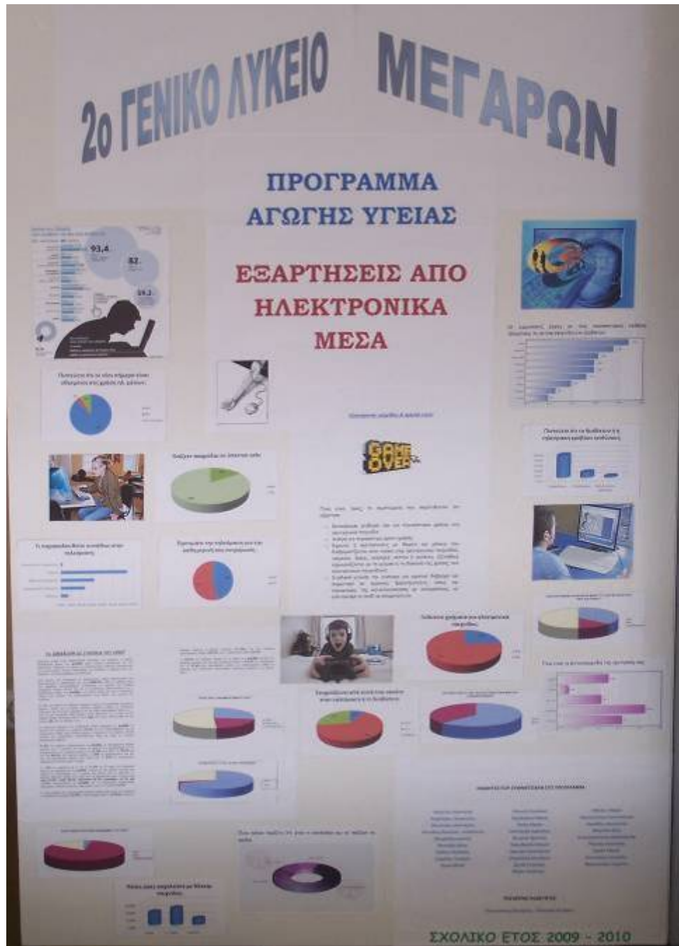
Το πόστερ του προγράμματος, που κατασκευάστηκε για να παρουσιαστεί στο Φεστιβάλ Σχολικών Δραστηριοτήτων