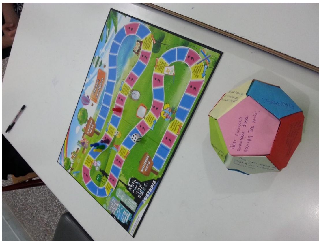
Το επιτραπέζιο παιχνίδι που φτιάξαμε και παίξαμε