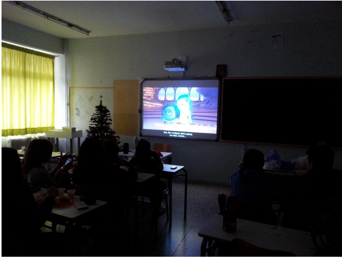
Προβολή ταινίας «Τα μυαλά που κουβαλάς»