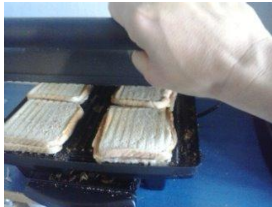
ΚΙΚΙ ΜΕ ΤΥΡΙ – ΤΟΣΤ